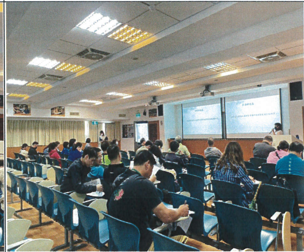
講師引用時事案例(四)