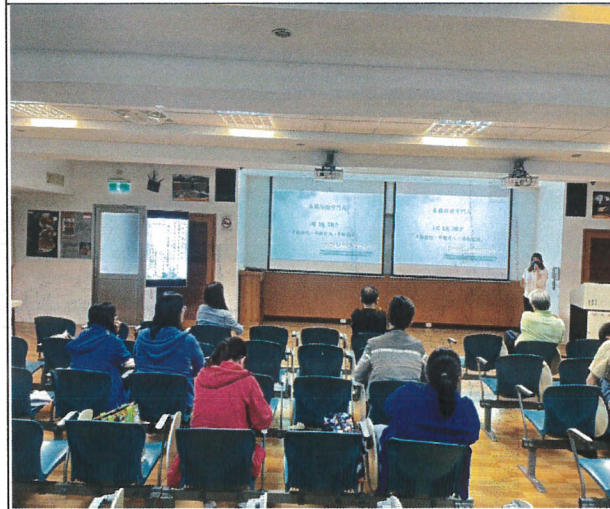
教職員專心聆聽(三)