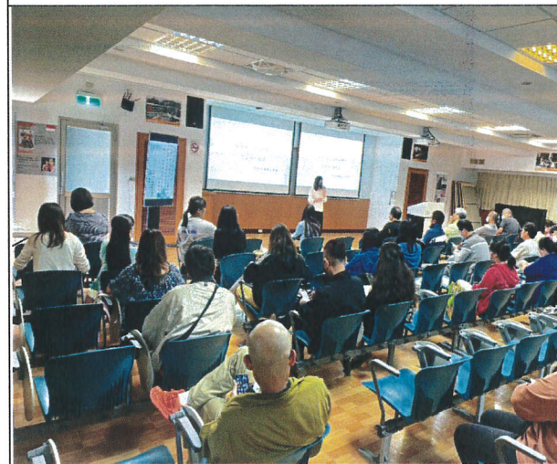
講師引用時事案例(五)