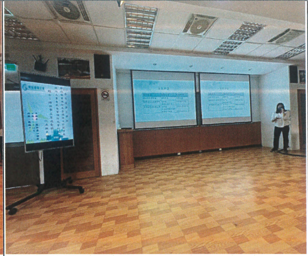
講師介紹課程內容(二)